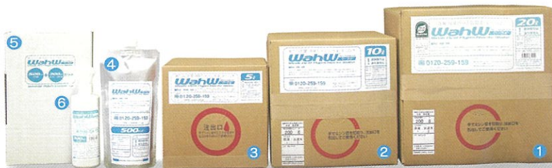
エコリーフ対象製品